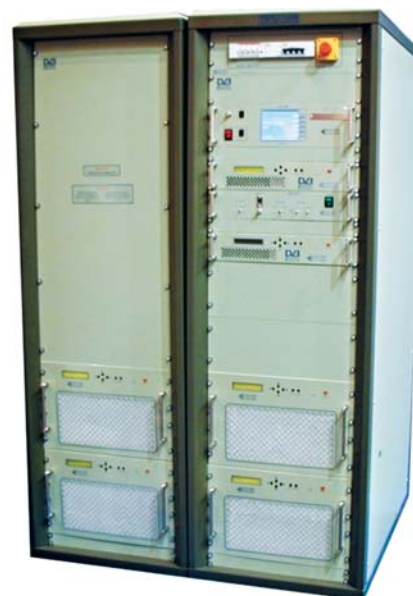
Цифровой передатчик TXTU-1200-R-2 производства НПП "Квант-Эфир"

Для успешного построения сети DVB-T/H очень важны качественные показатели главного передатчика.