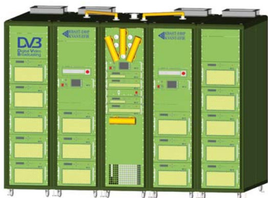
TXTU-20000-R-1 (20 кВт, аналоговый режим) TXTU-5000-R-2 (5 кВт, цифровой режим)