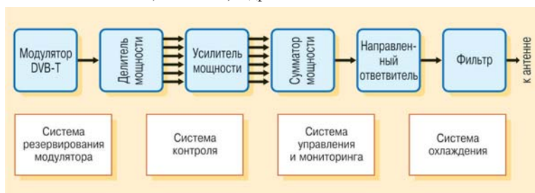
Рис. 1. Обобщенная структура построения цифровых передатчиков представлена

Среди передовых производителей цифровых передатчиков можно назвать: ABE, CTE, DMT, Electrosys, Eletronika, Elti, Harris, Kvant-Efir, Larcan, Mart, Mier, NEC, Plisch, ProTelevision, Robde&Schwarz, Screen Service, TeamCast , и др.