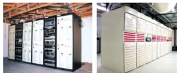
Передатчики Axcera малой (слева) и высокой мощности

Переход на цифровое телевизионное вещание в России начался. В связи с этим очень актуальным становится вопрос модернизации оборудования теле- и радиопередающих центров. В настоящее время подавляющее большинство телевизионных передатчиков, находящихся в эксплуатации у российских операторов, произведены в Европе. При этом незаслуженно мало внимания уделяется североамериканским производителям, чьи телевизионные передатчики не только обладают высокими характеристиками, но и, учитывая длительный период падения курса доллара, имеют серьезные ценовые преимущества. Одним из мировых лидеров в области производства телевизионного широкополосного оборудования (включая DVBH), оборудования для беспроводных сетей и MMDS вещания является американская компания Axcera (штат Пенсильвания, США). Компания работает на рынке телекоммуникаций с 1982 года и к настоящему времени заслужила репутацию производителя высоконадежного оборудования, а важнейший приоритет работы Axcera – максимальная ориентированность на потребности клиента.